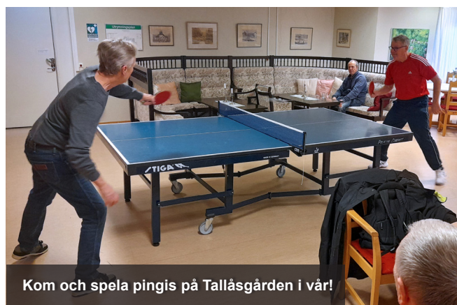
Kom och spela pingis på Tallåsgården i vår!

Det är drop-in, ingen anmälan och ingen kostnad. Aktiviteten genomförs i samarbete med RF-SISU Västmanland. Alla är välkomna oavsett tidigare erfarenhet!