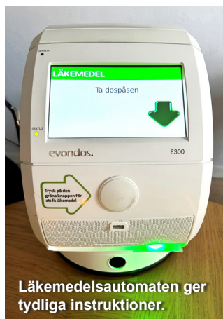
Läkemedelsautomaten ger tydliga instruktioner.